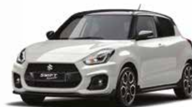
Bianco Artico / Nero