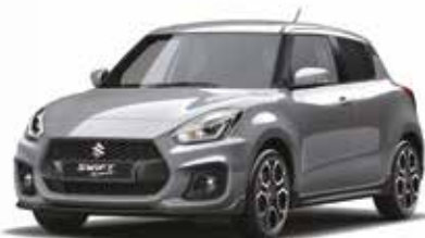
Argento New York