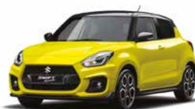
Giallo Champion / Nero