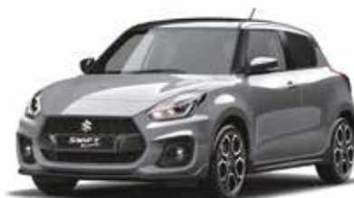
Argento New York / Nero