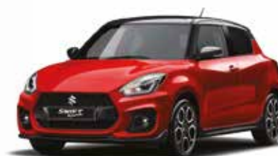
Rosso Cordoba / Nero