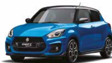
Blu Azzorre / Nero